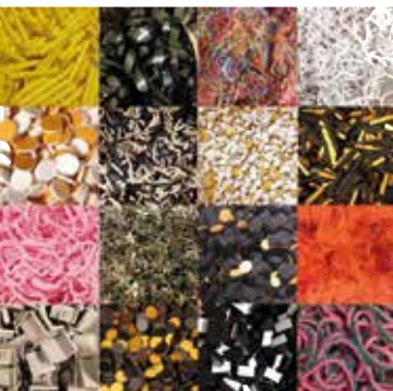
Material till återSKAPA

återbruk, design och utbildning i Malmö, som arbetar med lekfulla processer för att frigöra kreativitet, stärka självkänsla och öka