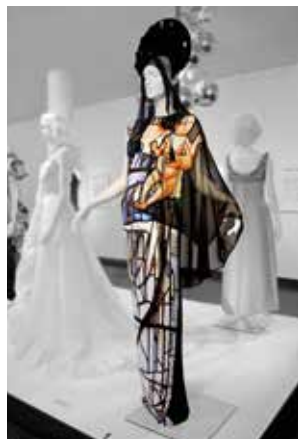
Jean-Paul Gaultier, Lumière , aftonklänning med diadem, in- köpt av Röhsska museet 2007.