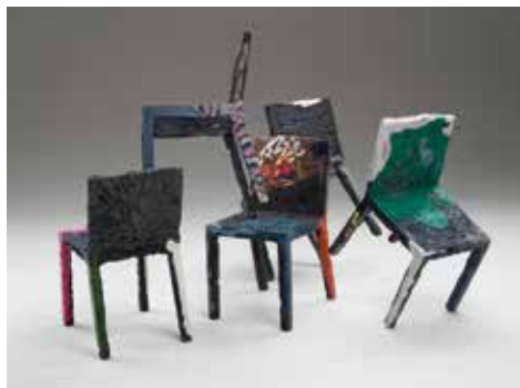
Rememberme formgiven av Tobias Juretzek för Horm/Casamania.

En dubbelbottnad relation • 14/9 – 24/11