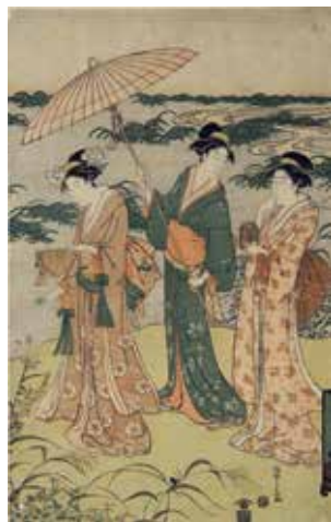
Chobunsai Eishi (1756-1829)