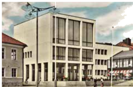
Falkenbergs stadshus ca 1963