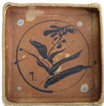
Kavlat stengodsfat med målad dekor i järnoxid, sent 1990-tal.