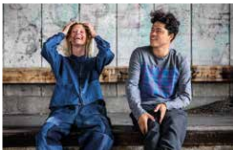
Fotografering för Remake hösten 2019, Foto: Anna Z Ek

Utställningen innehåller också en historisk del som handlar om den lokala soptippen Lövstaviken som anlades på 1950-talet vid Falkenbergss norra havsstrand, en gång stadens badstrand. Soptippens historia ger perspektiv på hur synen på naturen och naturvärdena skiftat med tiden. Den manar också till insikt om att ingenting med lätthet kan städas undan. Gårdagens osorterade sopor, lagda på hög under en period av närmare 40 år, kommer under översködlig tid att ligga där de ligger. Inkapslade under en gummiduk – som en tidskapsel till framtiden.